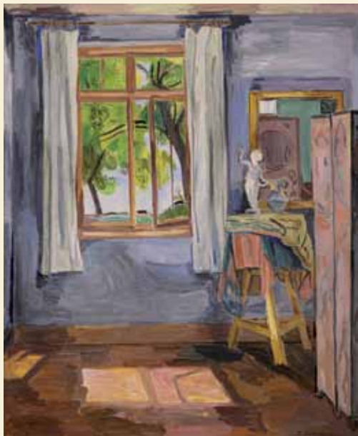
Hans Purrmann: Atelierinterieur in Langenargen, 1927. Museum Langenargen