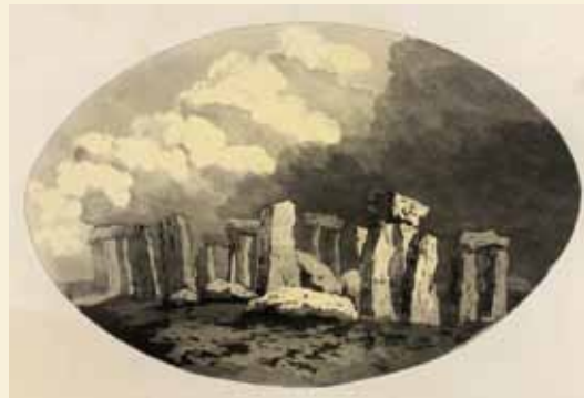
Samuel Alken nach William Gilpin: Pittoreske Landschaft (Stonehenge), 1808, Graphische Sammlung der Universität Trier