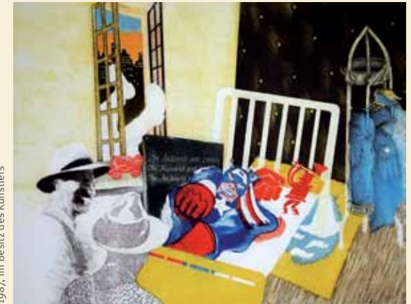
Eckhard Froeschlin: Die Russen kommen, 1987, im Besitz des Künstlers

der Aquatinta. Ein Raum mit Werkzeugen, Zustandsdrucken und Druckplatten rundet die Schau ab und offenbart, welche große Könnerschaft zur Herstellung von Druckgraphiken notwendig ist, wie sie in der Ausstellung gezeigt werden.