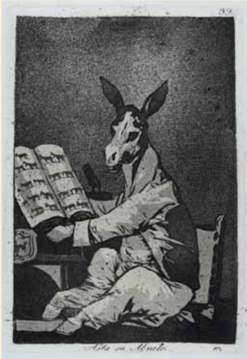
Francisco de Goya: Bis zu seinem Großvater (Capricho Nr. 39), um 1797–99, Graphische Sammlung der Universität Trier