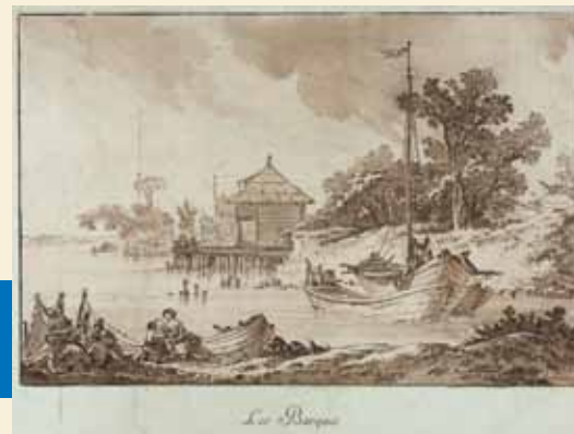
Jean-Baptiste Le Prince: Die Bâques, 1769, Graphische Sammlung der Universität Trier