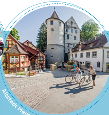
Altstadt Meersburg 3